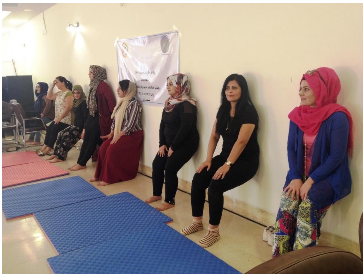
Første modul af et TRE uddannelses hold i Kurdistan, Irak. Da TRE består af fysiske øvelser, er den sproglige barriere ikke noget problem.

Du bliver Certified TRE Provider , som vi på dansk kan oversætte med Certificeret TRE-udbyder. Du vil erhverve dig et unikt værktøj, både personligt, relationelt og fagligt. Uddannelsen er bygget op omkring 2 moduler af tre dages varighed. Dertil kommer egen-erfaring med TRE, praktik, konsultationer, supervision, peergruppemøder og litteraturstudier – sammenlagt et forløb over et års tid.